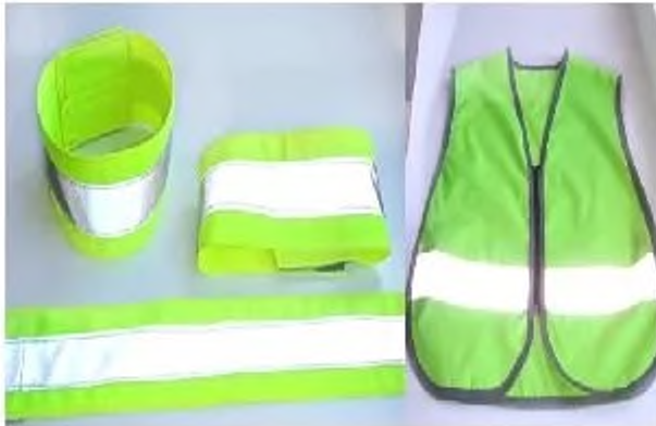
Светоотражающие повязки, значки и жилеты